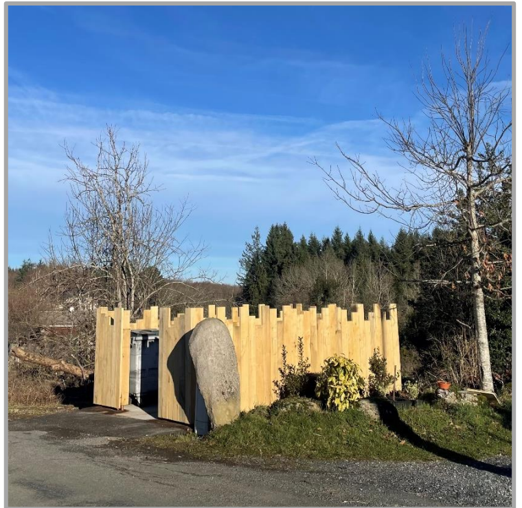
L'espace de propreté des Lauradous a été rénové sur un terrain cédé à la mairie.

Au premier plan la statue menhir dont la gravure est usée par les intempéries Elle provient d'un champ labouré, non loin, en amont.