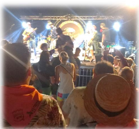
Groupe Local Cèpes Cultura