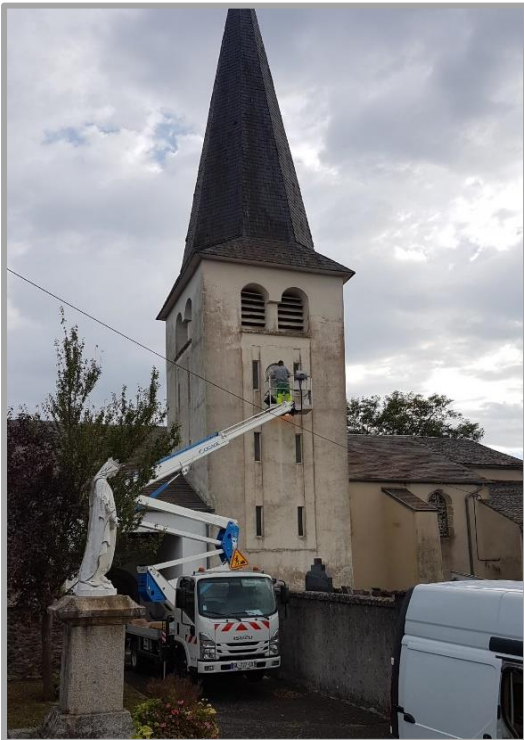
Rénovation de la peinture de l'horloge de Saint-Agnan