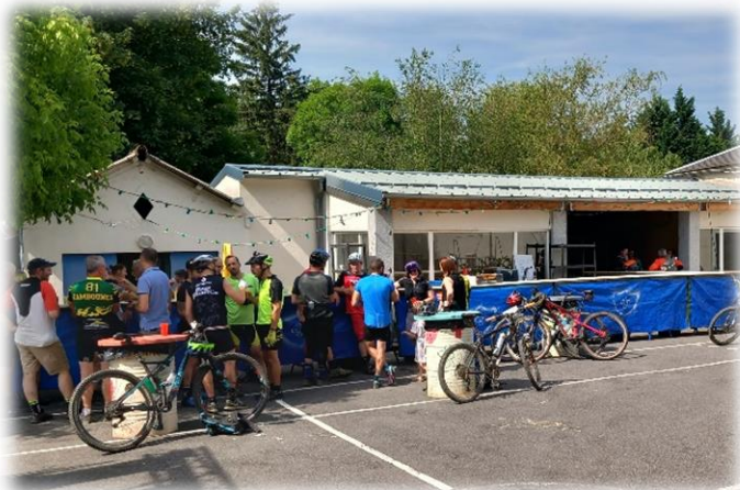
Arrivée de la randonnée VTT